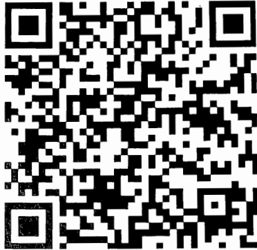
QR Code für TWINT

https://refbrugg.ch/angebote/musik/orgelpunkt/